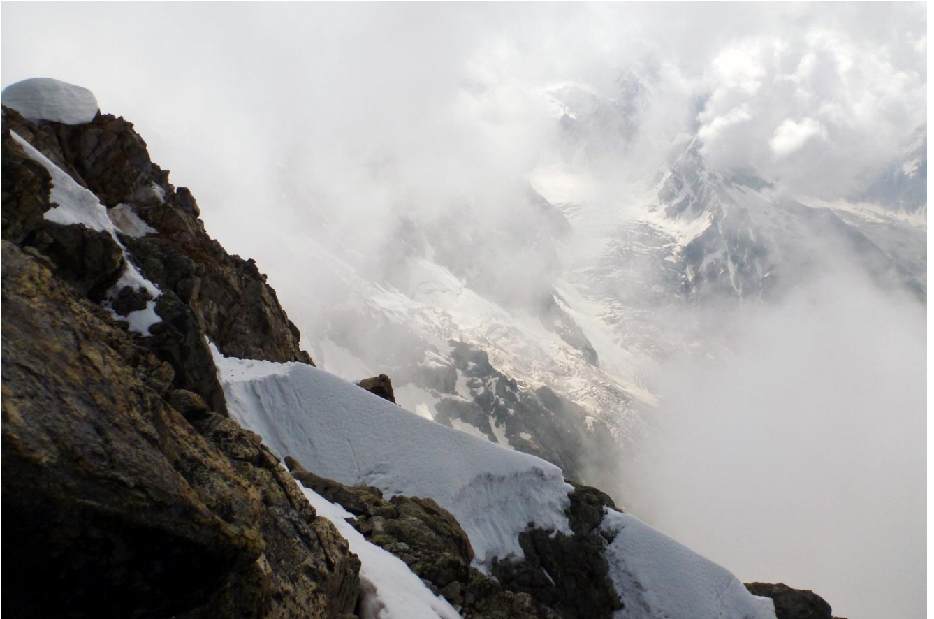
Фото 7. Площадка для ночёвки у верхней части маршрута.