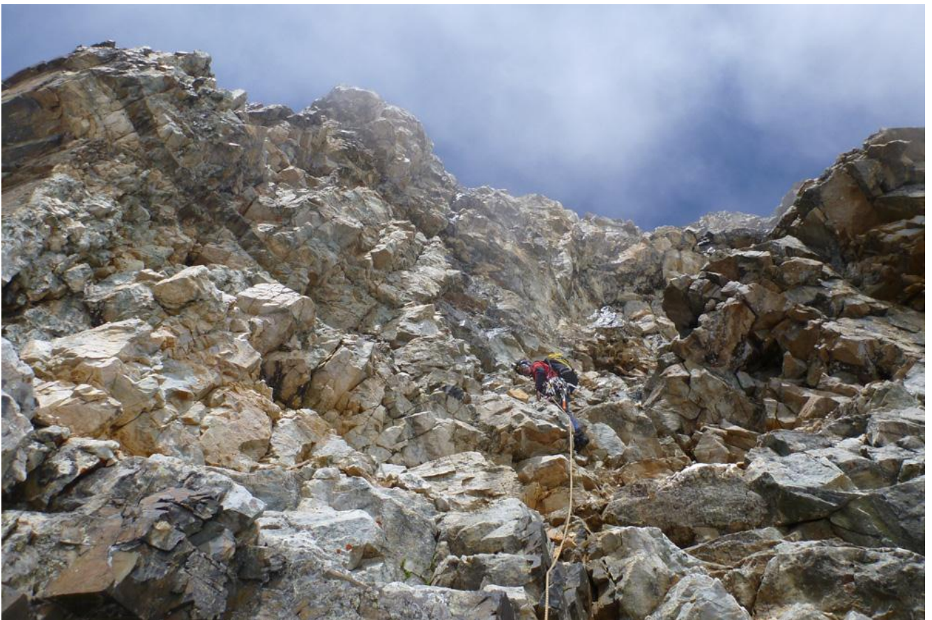
Фото 8. Сыпучий кулуар перед вершинным взлётом.