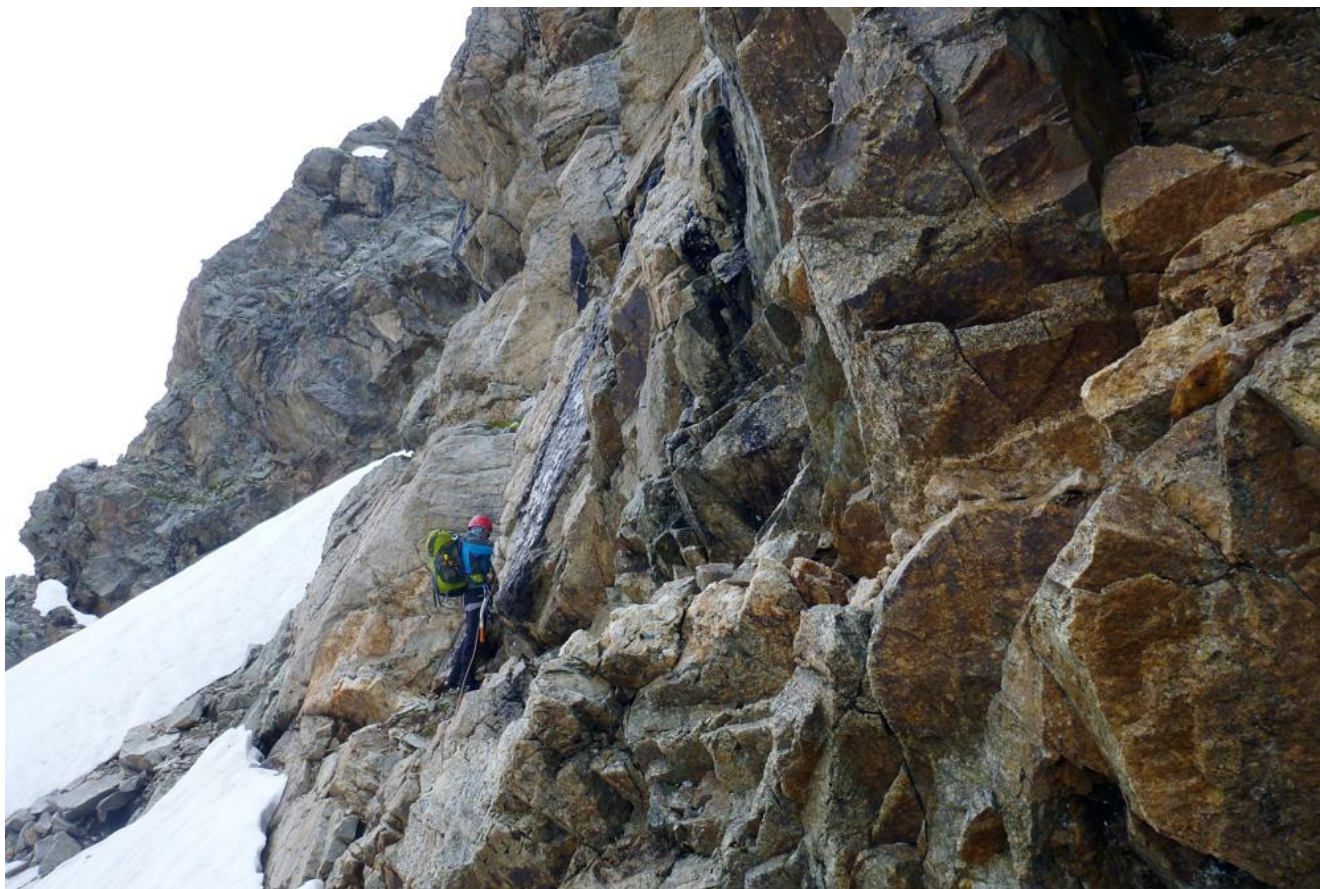
Фото 6. Трудные скалы перед выходом на ребро.

В 7.00 выходим на маршрут. Сначала по пологому снежному склону ( 30^\circ ) вверх и вправо 80 метров, далее 20 метров вверх по трудным скалам ( 70^\circ - 80^\circ ), затем 20 метров траверсом направо и снова вверх 5м (фото 6).