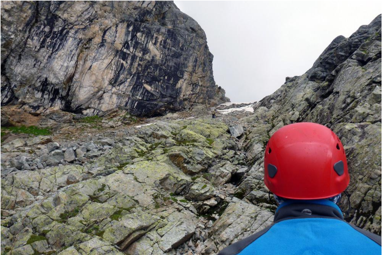
Фото 2. Подъём к началу стенной части.