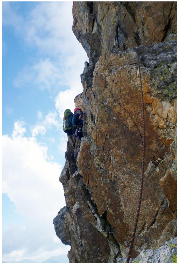
Фото 4-5. Стенная часть выше ключевого участка.