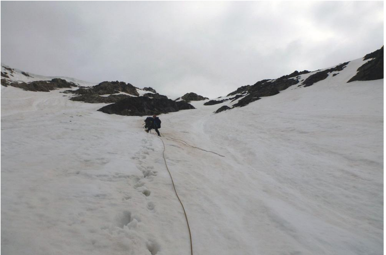
Фото 10. Спускной снежный склон.

Вышли в 8.00, спускаться решили по не крутому (45°) фирновому склону между маршрутами ЗБ и ЗА к. сл., на что ушло примерно 2 часа (фото 10). Такой спуск безопасен только в первой половине дня. Во второй по желобу склона начинают идти лавины. Ещё час понадобился, чтобы преодолеть две ступени ледника и выйти на тропу к ночёвкам у начала маршрута.