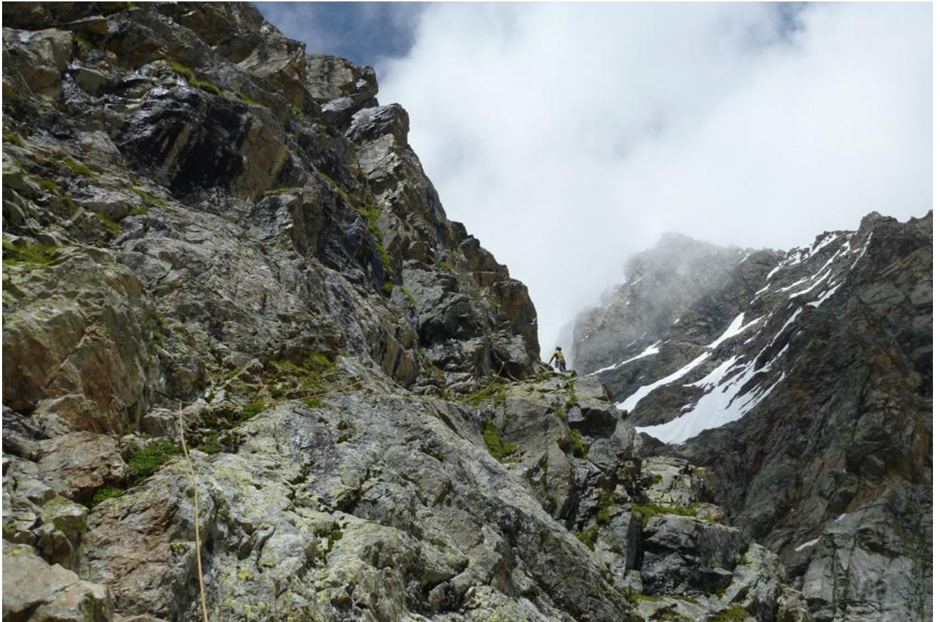
Фото 3. Преодоление первой верёвки стенной части.