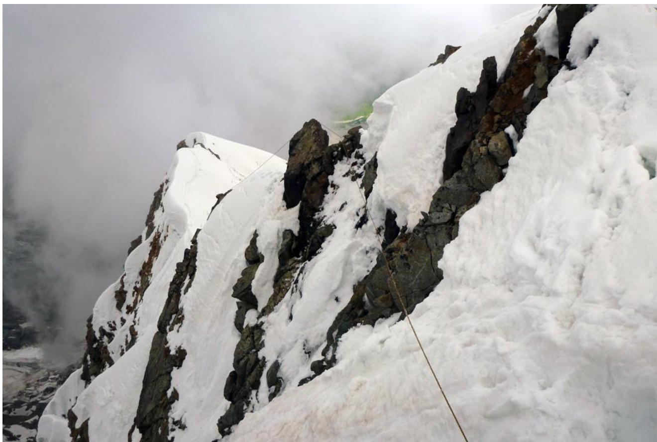
Фото 9. Вершинный взлёт.

Далее, сначала 50 метров по не крутому ( 40^{\circ} ) снежному склону к скальной гряде, где можно организовать станцию. После неё участок острого, практически без набора высоты, снежного гребня 50м без каких-либо скальных выступов, с карнизами в обе стороны, который заканчивается станцией на скале.